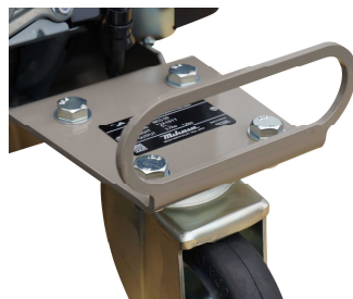
積み降ろし用取っ手