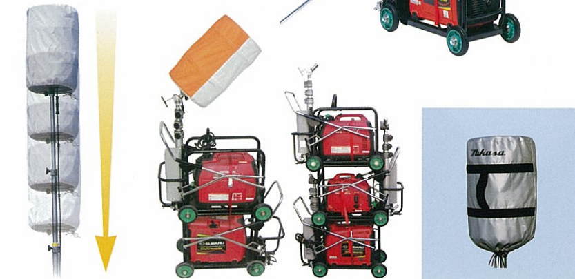
緩やかに降下するエアードンパーを採用。