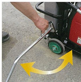
転倒防止のワンタッチ式アウトリガーを装備。