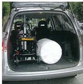
ライトバンで運搬可能です。