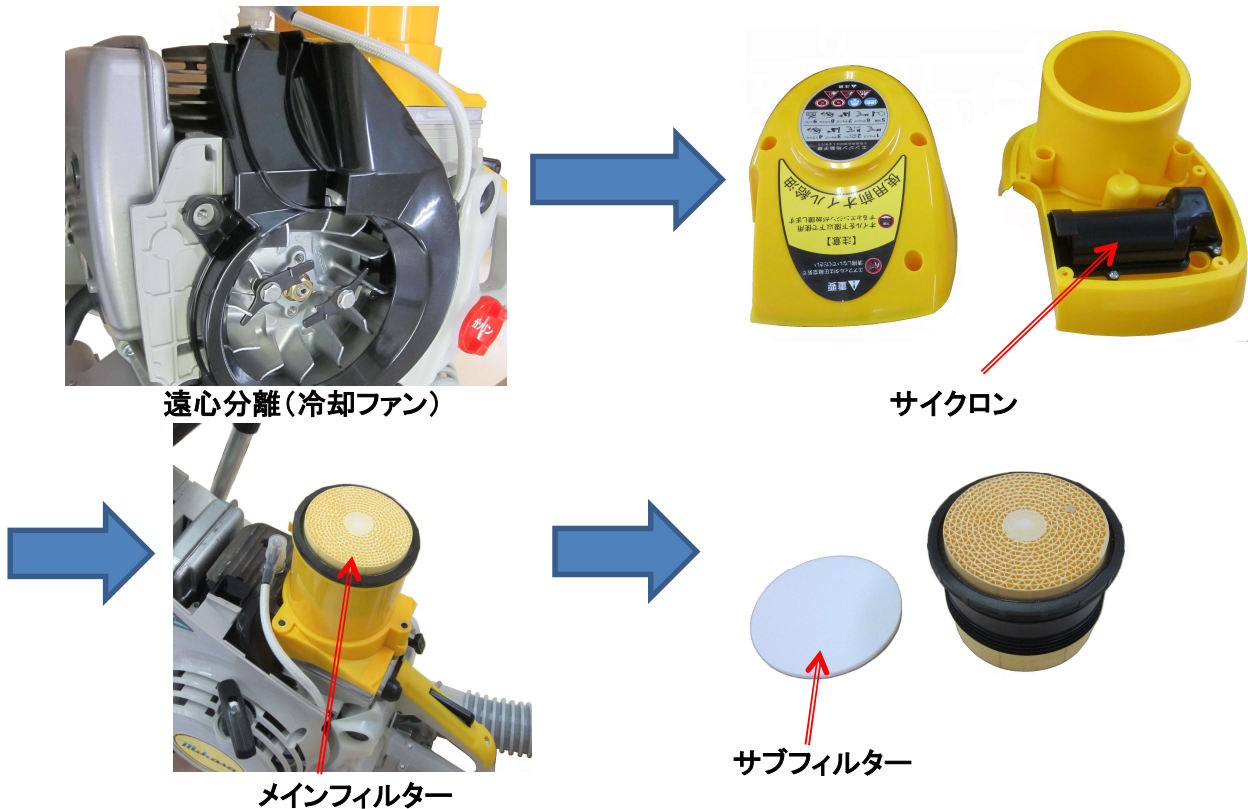
遠心分離(冷却ファン)