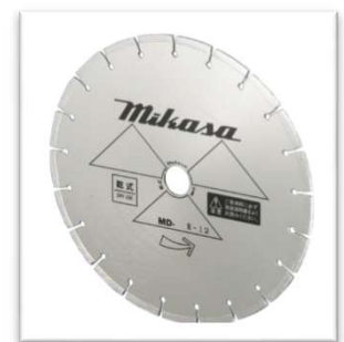
12 \frac{1}{2} "MD-Rシルバー 本体価格:¥32,000(税抜)