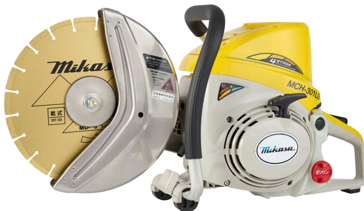
MCH-301LB 本体価格: ¥240,000(税抜)