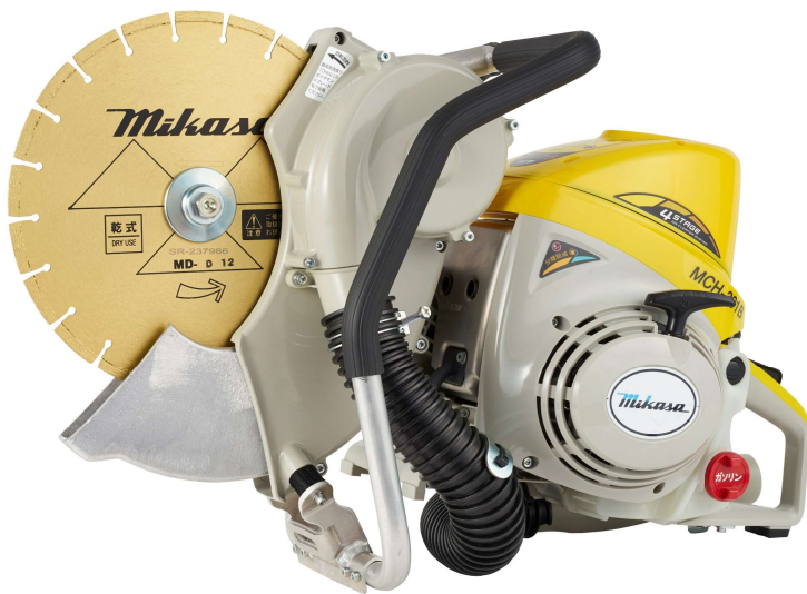
MCH-301B 集塵装置付 本体価格: ¥309,000(税抜)