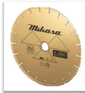
12 \frac{1}{2} "MD-Dゴールド 本体価格:¥48,000(税抜)

プライマリポンプ ポンプ内に燃料が吸いあがるまで プライマリポンプを5~6回押してください