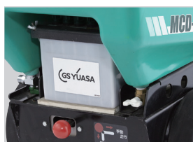
3 メンテナンス性を考慮したバッテリー配置