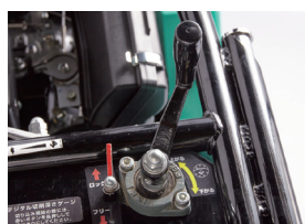
1 ワンタッチで昇降動作を固定できるカム式ロック