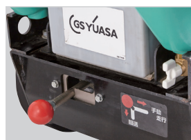
5 半自走切替レバー (スプリングリターン式)