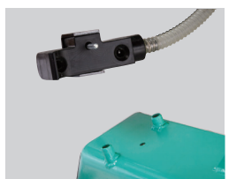
6 清掃を容易にした散水ホースブロック