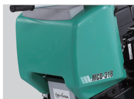
4 点検、清掃しやすい大型水タンク (50ℓ)