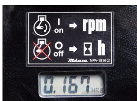
2 タコ・アワメーター