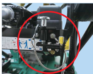
ハンドル固定用ワイヤ・ 移動車収納用ストッパー(T90)