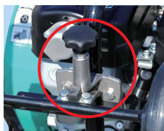
移動車収納用ストッパー (F60・F70系)